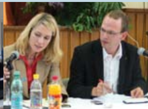
... Ministerin für Soziales Manuela Schwesig