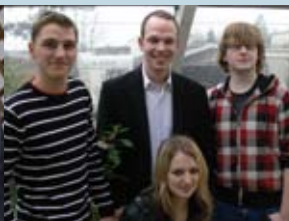
... Jusos in Uecker-Randow