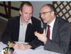
... Ministerpräsident Erwin Sellinging